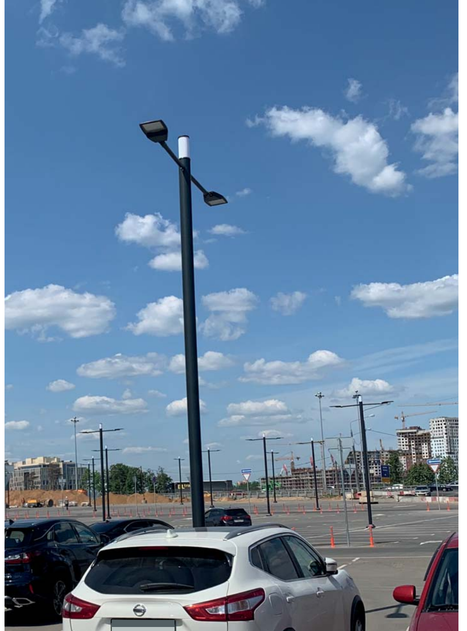
Salaris Mall, Rusya