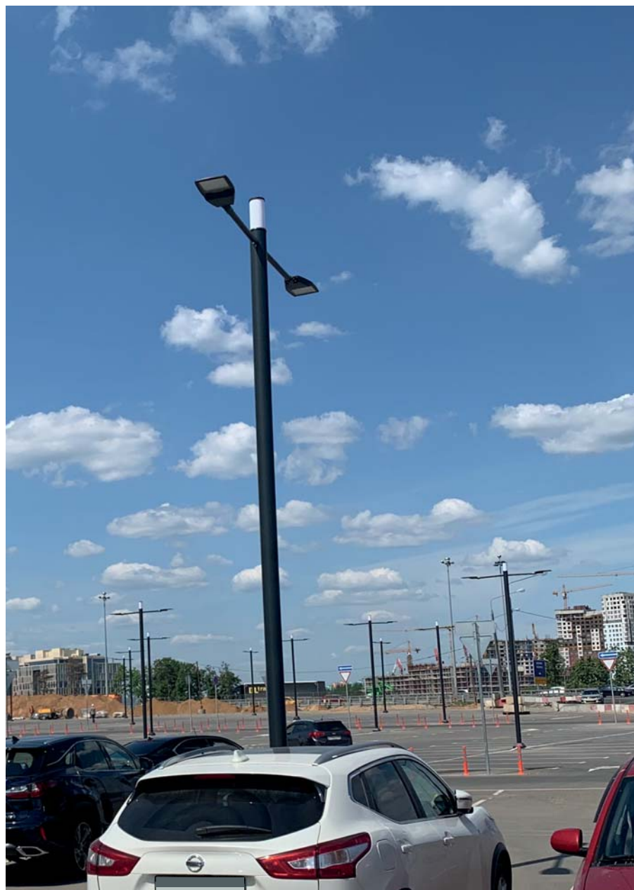
Саларис ТЦ, Россия.