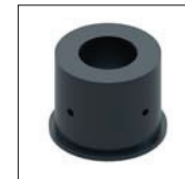
24011271 Монтажный аксессуар

* Может быть установлен на опоре Ø60 мм с помощью монтажных принадлежностей